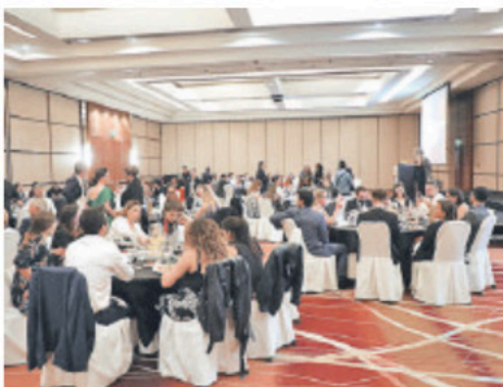
▲ Los invitados y premiados durante la ceremonia de distinción.