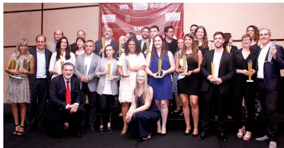
Así celebrábamos la primera entrega de los Premios EIKON Chile el 13 de noviembre de 2019, ocasión en la que fueron galardonados 23 casos. En este 2020, esta ceremonia no pudo realizarse de manera presencial por causa de la actual pandemia.