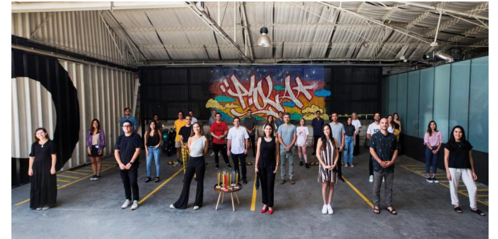
▲ Equipo completo de ALTA COMUNICACIÓN CHILE.