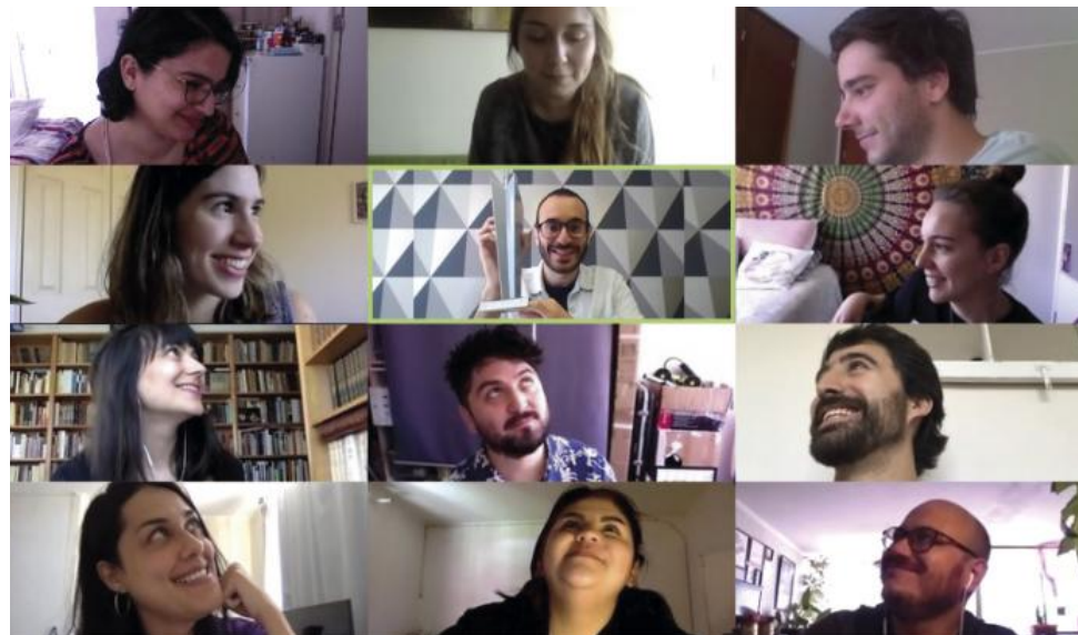
▲ REACTOR AGENCIA DIGITAL: Los equipos de Contenido, Diseño y Web.